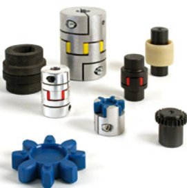
Drehelastische / flexible Kupplungen, Zahn- und Kettenkupplungen