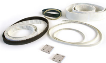
Zahnriemen und Klemmplatten