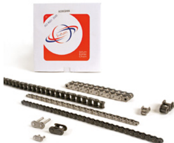
Rollenketten und Verschlussglieder SATURN