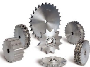
Kettenradscheiben für Rollenketten nach DIN 8187