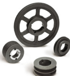
Keilriemenscheiben für Taperbuchsen