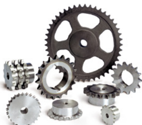
Kettenräder für Rollenketten und Taperbuchsen