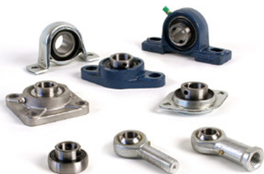
Flansch- und Stehlager, Spannlager, Gelenkköpfe DIN 648