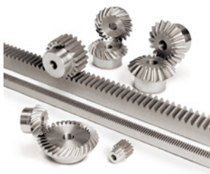
Zahnräder, Zahnstangen, Kegelräder