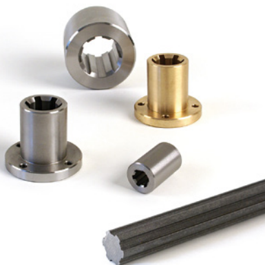
Keilwellen und Keilnaben