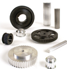
Zahnriemenräder, Zahnwellen, Bordscheiben