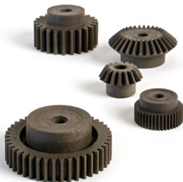
Zahnräder und Kegelräder aus Thermoplastik