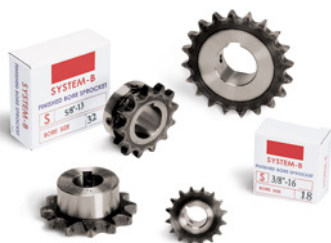
Kettenräder System BEA