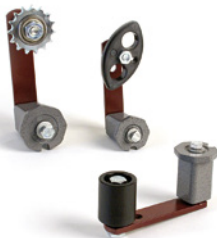
Spanner für Ketten und Zahnriemenantriebe, Kettengleiter, Laufrollen