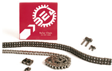
Rollenketten und Verschlussglieder BEA