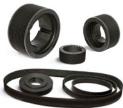
Poly-V Keilrippenriemenscheiben für Taperbuchsen, Poly-V Keilrippenriemen