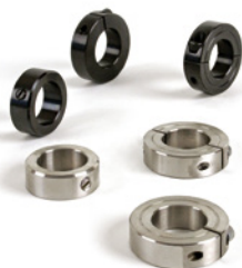
Klemm- und Stellringe